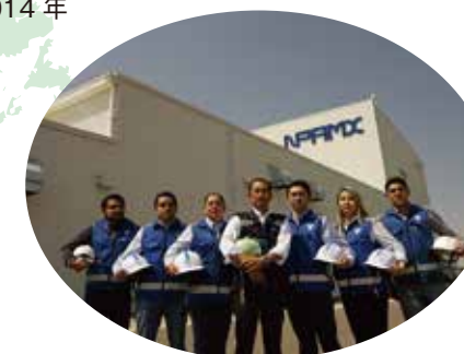
塗料製造工場（メキシコ）

タカサゴエンジニアリング・メキシコ Takasago Engineering Mexico, S.A. DE C.V. 設立：2014年