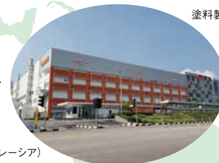
半導体工場（マレーシア）

TTE・マレーシア T.T.E. Engineering (Malaysia) Sdn. Bhd. 設立：1980年