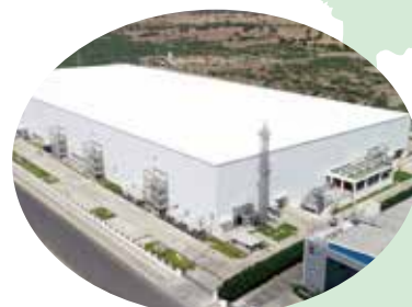
車載電池工場大型ドライルーム（インド）

ICLEAN 社 Integrated Cleanroom Technologies Pvt., Ltd. 設立：2002年