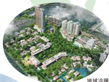
地域冷暖房設備（タイ）