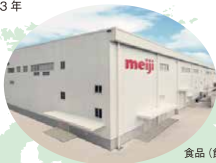
食品（飲料）工場（中国）

高砂建築工程（中国）有限公司 Takasago Constructors & Engineers (China) Co.,Ltd. 設立：2003年