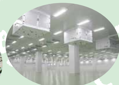
パネル製作及び取付工事（インド）