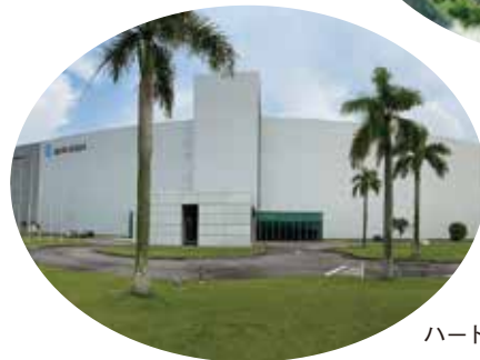
ハードディスクメディア工場（シンガポール）

タカサゴ・シンガポール Takasago Singapore Pte. Ltd. 設立：1974年